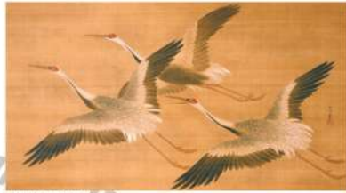
舞鶴図 狩野常信筆（国重文、一橋徳川家関係資料、当館蔵）