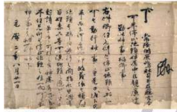
源頼朝下文（鹿島神宮文書）（茨城県指定文化財、鹿島神宮蔵（当館寄託））