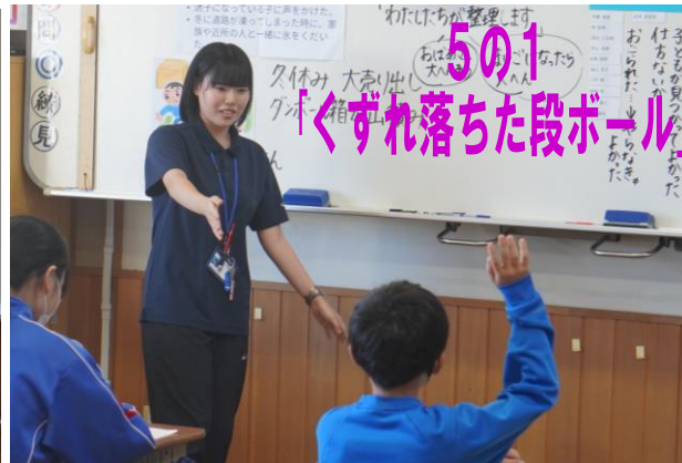
5の1 くずれ落ちた段ボール