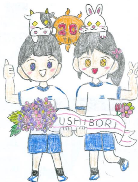
20周年記念キャラクター